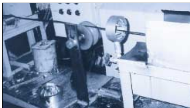
La photo montre un anneau de soufflage SILVENT 456 séchant un câble en production continue.

Buse de sécurité Répond aux normes de sécurité OSHA