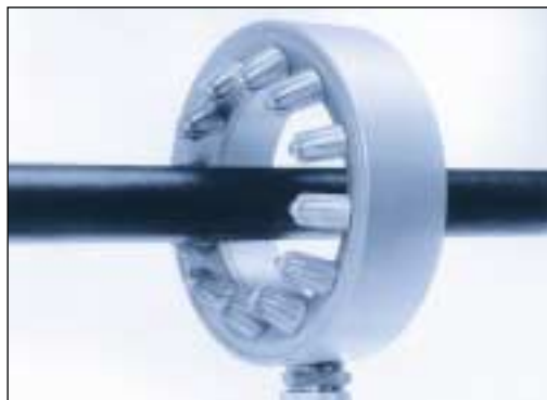
Nettoyage et séchage d'un tube de 38 mm (1.5") de diamètre par la SILVENT 462.

La SILVENT 462 est une buse montée en anneau pour sécher et nettoyer efficacement câbles, profilés, tubes, etc. Cette conception permet le passage en continu à travers l'anneau. Douze jets d'air concentrés opèrent simultanément et nettoient ou séchent au fur et à mesure. L'anneau convient pour câbles et profilés de 25 à 80 mm ( 1"-3 3/16" ) de diamètre. Breveté.