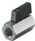
N° de commande : KV 14