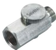
N° de commande : FV 14