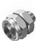
N° de commande : PSK 14