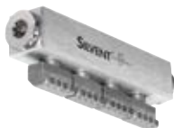
N° de commande : 364