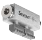
N° de commande : 362