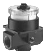
N° de commande : SR 34