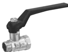
N° de commande : KVM 38