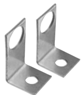
N° de commande : 3302